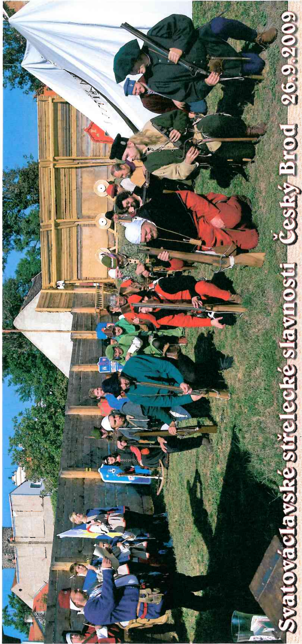
Svatováclavské střelecké slavnosti Český Brod 26.9.2009